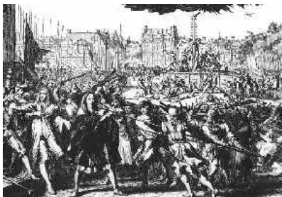
De moord op Johan de Witt en zijn broer.

Den Haag Als regeringsstad was Den Haag vaak het decor van vieze machtsspelletjes en politieke ruzies. In 1672 kwam dit tot een dramatisch dieptepunt, namelijk het molesteren en vermoorden van twee belangrijke figuren uit de politiek, Johan en Cornelis de Witt. Johan was raadspensionaris van Holland, een soort minister president. Zijn broer Cornelis was burgemeester van Dordrecht. Johan deed het als raadspensionaris eigenlijk hartstikke goed. Tot 1672, want toen ging het helemaal mis. Met de economie ging het slecht en Nederland raakte in oorlog met Engeland, Frankrijk en twee Duitse staatjes. Johan de Witt werd hiervoor verantwoordelijk gehouden en hij werd dan ook ontslagen. Cornelis werd opgepakt en in de gevangenschap gezet, omdat er werd gedacht dat hij plannen aan het maken was om stadhouder Willem III te vermoorden.