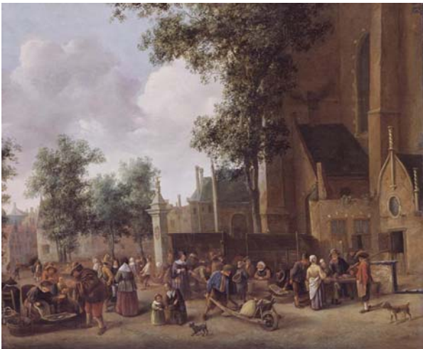
De Riviervismarkt, gezien naar het Westeinde, geschilderd door Jan Steen

Den Haag In Den Haag wemelde het van de 'rijke stinkers'. Omdat Den Haag het politieke centrum van Nederland was, kwamen veel rijke mensen, die invloed wilden hebben op de politiek in Den Haag wonen. Toen het in de gouden eeuw heel erg goed ging met Nederland werden ook deze mensen steeds rijker. Ze lieten prachtige huizen bouwen aan het Lange Voorhout, de Kneuterdijk en de Lange Vijverberg. Deze huizen moesten natuurlijk ook ingericht worden, met chique meubels, mooie tapijten, maar vooral met... Schilderijen! Voor schilders, die een beetje goed konden schilderen,