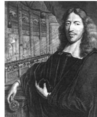
Johan de Witt

Johan de Witt was erg succesvol als raadpensionaris. Nederland bevond zich toen in een bloeiperiode, want het ging economisch heel erg goed en in de Tweede oorlog met Engeland, werden de Engelsen verpletterend verslagen. In 1672 ging het helemaal mis met Nederland, want het werd van 3 kanten aangevallen. De Witt moest hiervoor boeten. Hij werd door de Haagse bevolking mishandeld en vermoord.