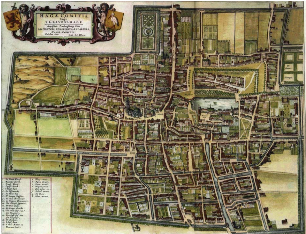
Plattegrond van Den Haag uit 1652, gemaakt door Johannes Blæw