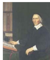
Jacob Cats