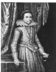
De Winterkoning

ning zijn vrouw Amalia kennen, die hofdame was bij Frederik. Frederik Hendrik was zó verliefd op Amalia, dat hij zelfs een portret van haar op zijn kamer had gehangen, al ontkende hij dat natuur-