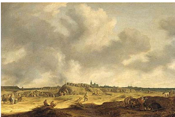
Het beleg van 's-Hertogenbosch, geschilderd door P. de Neyn (Coll. Rijksmuseum Amsterdam)

ren. Maar niet zonder hulp, want de waterbouwkundige Leeghwater legde voor hem het moeras rond de stad droog. De rest was een makkie.