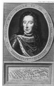
Willem III

volgde Willem hem op. Willem wilde ook belangrijk worden op het slagveld, maar helaas voor hem tekende Nederland in 1648 de vrede met Spanje in het Duitse Münster. Willem voelde zich zo gefrustreerd, dat hij besloot Amsterdam aan te vallen met zijn leger, om te laten zien dat hij de baas was en niet de regenten die de vrede hadden getekend. Willem overleed vlak hierna, hij was pas 24 jaar!