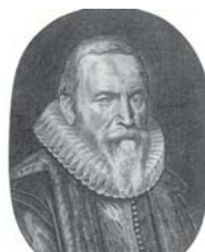
Johan van Oldenbarnevelt

Johan van Oldenbarnevelt (1547-1619) was vanaf 1586 raadpensionaris. Samen met prins Maurits was het een succesvol duo. Maurits voerde oorlog op het slagveld en van Oldenbarnevelt zorgde dat er steeds maar weer geld was. Later kwamen de twee in conflict vanwege een godsdienstige kwestie. Maurits liet van Oldenbarnevelt arresteren, gevangen zetten in de Gevangenispoort en onthoofden.