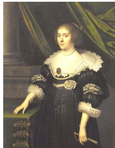
Amalia van Solms, door M. van Mierevelt

dat het kind persé Willem zou gaan heten, naar de vader van de baby. Zo hebben schoonmoeder en schoondochter urenlang staan ruziën bij de ingang van de kerk, voordat de baby gedoopt werd. Intussen zaten de gasten maar binnen te wachten en te wachten en te wachten... Uiteindelijk kreeg oma Amalia haar zin en werd het Willem.