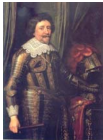
Frederik Hendrik

Spaanse leger in de slag bij Nieuwpoort aan de Belgische kust in 1600. In Den Haag woonde hij op het Binnenhof, wat hij naar zijn eigen smaak liet verbouwen en inrichten. Het dieptepunt was de onthoofding van Johan van Oldenbarnevelt in 1619 met wie hij jarenlang een succesvol duo vormde. Maurits is nooit getrouwd geweest, maar hij had wel een relatie met Margareta van Mechelen.