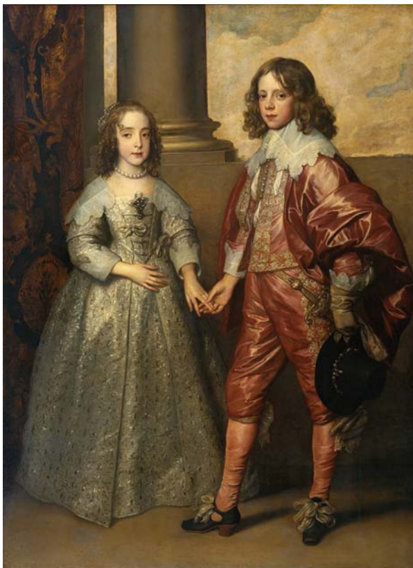
Willem II en Mary Stuart, geschilderd door Antoon van Dyck

Londen. De zoon van stadhouder Frederik-Hendrik, Willem is in Londen getrouwd met de Engelse prinses Mary Stuart. Willem was pas 15 jaar en zijn vrouw was zelfs nog maar 10. Het is in deze tijd eigenlijk ook niet meer dan normaal dat prinses en prinsessen al op zo'n jonge leeftijd met elkaar trouwen. Zij hebben er zelf dan ook niets over te zeggen. In het geval van Willem was het zo, dat de ouders van Willem, Frederik-Hendrik en Amalia wilden dat hun enige zoon met een belangrijke prinses zou trouwen om zo de status van de familie te verhogen. Frederik-Hendrik was namelijk maar een stadhouder en die hadden veel minder macht dan koningen, zoals ze die in Frankrijk en Engeland hadden. Door deze bruiloft kreeg de familie van Oranje kreeg zo een koninklijk tintje. Dat was leuk voor Frederik-Hendrik en Amalia, maar of Willem en Mary dit nou zo leuk vonden...? De aankomst van het kersverse bruidspaar in Den Haag was prachtig. De moeder van de prinses, de koningin van Engeland kwam mee, samen met 300 man personeel. Dat moest heel indrukwekkend zijn