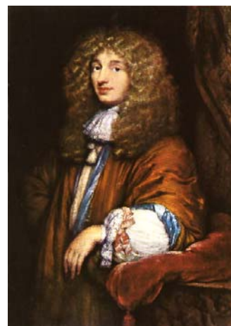
Christiaan Huygens

weer bijgesteld worden. Het slingeruurwerk had slechts een afwijking van een paar minuten per jaar! Dit was natuurlijk veel handiger. Huygens deed nog veel meer uitvindingen, zoals lenzen, die hij maakte om het heelaal te bestuderen.