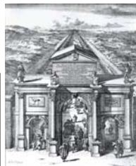
De Scheveningseweg (HGA)

smalle paadjes door de duinen. Vooral handelaren en vissers werden onder-