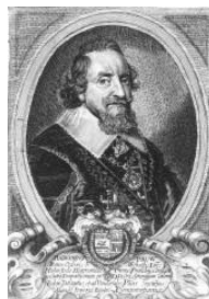
Adriaan Pauw