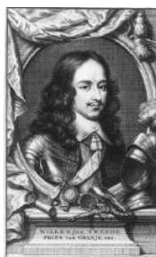
Willem II

net als Maurits ook geen tijd om te trouwen. Maurits smeekte Frederik Hendrik op zijn sterfbed om toch te trouwen om de familie voort te zetten. Hij trouwde snel met Amalia van Solms, met wie hij 1 zoon en 4 dochters kreeg. Frederik Hendrik en Amalia hielden van pracht en praal. Ze lieten Huis ten Bosch bouwen in Den Haag en andere grote paleizen in Rijswijk en Honselersdijk