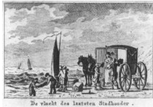
De vlucht van Willem V naar Engeland

grote delen te veroveren. Ze waren al bij Utrecht! Willem en Wilhelmina besloten te vluchten. In Scheveningen stapten ze halsoverkop aan boord van een vissersboot, waarmee ze naar Engeland gingen. Ze moesten al hun dure