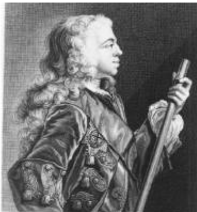
Stadhouder Willem IV

want ook de Fransen hadden grondgebied in Amerika. De oorlogen tegen de Fransen hadden de Engelsen veel geld gekost, waardoor de in hun deel van Noord-Amerika meer belasting gingen heffen. De burgers van de 13 staten, die onder Engels heertogen in opstand en verklaarden zichzelf onafhankelijk. Onder leiding van George Washington werd een 6 jaar lange oorlog gevoerd om de Engelsen eruit te werken. In 1783 was het eindelijk zover en werd Washington president.