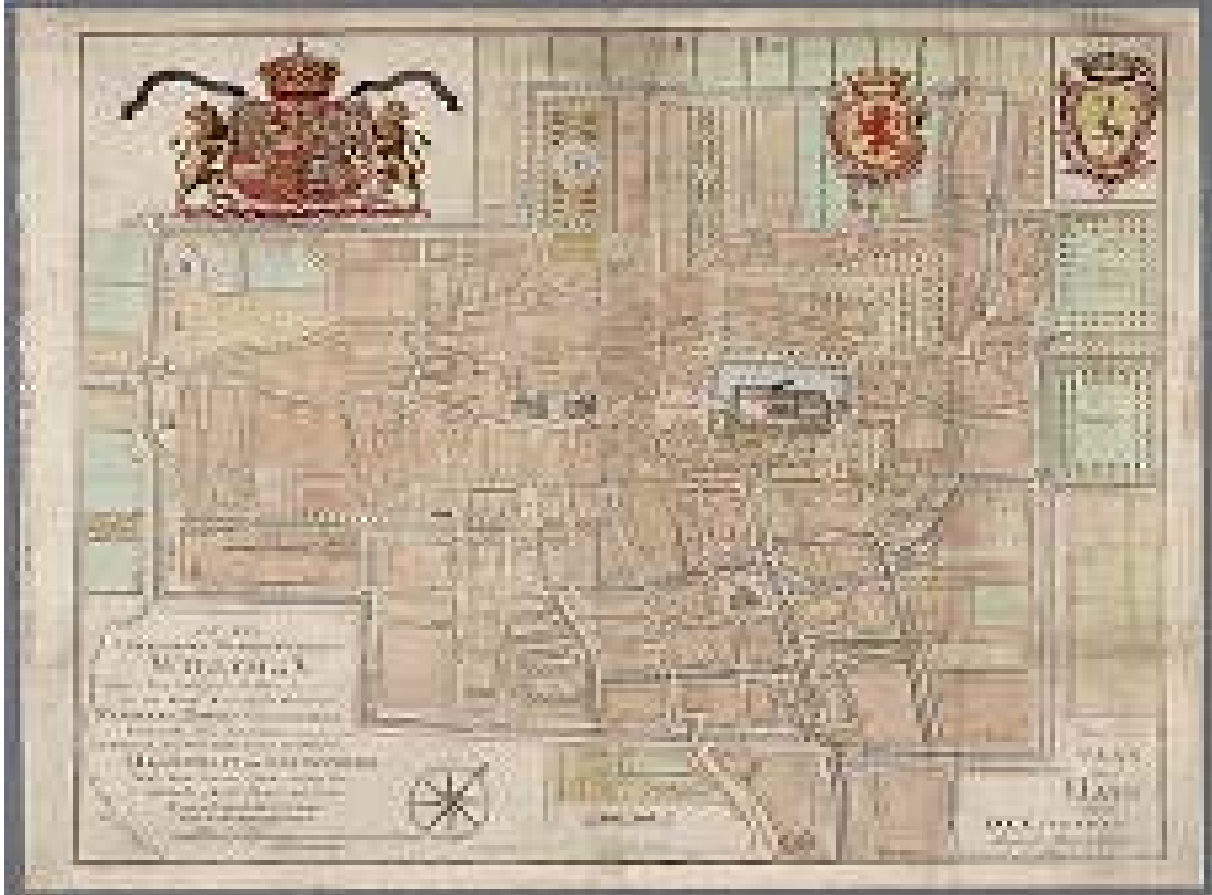
Plattegrond van Den Haag uit 1767