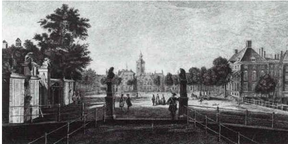
Het Buitenhof in 1775, helemaal rechts de galerij van Willem V

Den Haag Stadhouders Willem V had zelf nooit gestudeerd aan een universiteit, maar hij had wel degelijk interesse in allerlei wetenschappelijke zaken. Zo had Willem een enorme collectie opgezette dieren, skeletten, fossielen en beesten op sterk water. Ook had Willem een gigantische bibliotheek en een grote schilderijenverzameling. Veel koningen en andere heersers in Europa hadden zulke verzamelingen om te laten zien hoe rijk ze waren of om op te scheppen tegenover andere koningen, maar Willem was echt geïnteresseerd in deze dingen en hij breidde zijn collectie dan ook fors uit. Willem wilde de collectie niet alleen voor zichzelf houden en kocht daarom