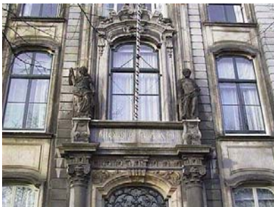
Huis Huguetaan aan het Lange Voorhout

deze stijl gebouwd. De architect Daniël Marot ontwierp veel van deze gevels, maar hij ontwierp