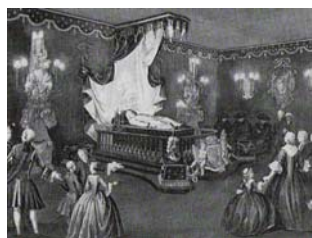
Willem IV op zijn sterfbed

Dat jaar besloten ook de regenten in Den Haag om het stadhouderschap voor altijd af te schaffen. Dit was een grote teleurstelling voor Willem. In 1734 trouwde Willem met de dochter van de Britse koning, Anna van Hannover, met wie hij een gelukkig leven zou leiden. In 1747 beleefde Willem zijn 'finest hour', toen Nederland in oorlog raakte met Frankrijk. Het Nederlandse volk vond, dat de regenten veel te zwak waren en geen leiding konden geven. Zij wilden de Oranjes weer terug. De regenten besloten Willem te accepteren als hun stadhouder. Stadhouder Willem IV stierf helaas al vroeg. Hij was pas 40 jaar!