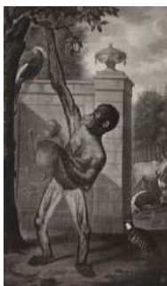
De aap van Willem V (HGA)

Als het niet van de Nederlandse kou was, gingen ze wel dood omdat ze bijvoorbeeld niet de juiste voeding kregen. In die tijd wist men bijna niets over het leven en de eetgewoonten van tropische dieren.