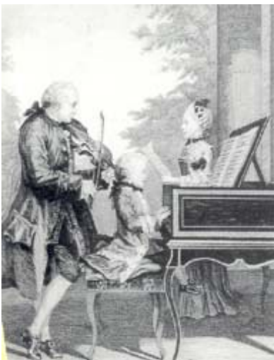
Vader Mozart, Wolfgang en Nannerl in actie