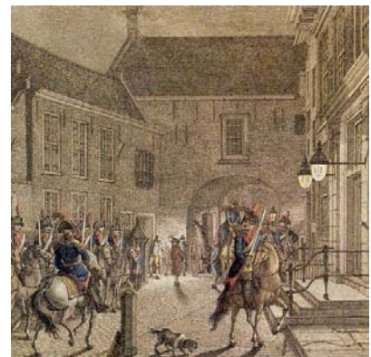
Van de Spiegel gaat naar de Gevangenpoort

mogelijke manieren lastig te maken. Via een spionne, Etta Palm, kwam hij te weten, wat zij allemaal deden. Toen na het vertrek van Willem V de patriotten aan de macht kwamen, werd van de Spiegel gevangen genomen. Drie jaar later werd hij weer vrij gelaten. Laurens van de Spiegel vertrok naar Duitsland, waar hij de rest van zijn leven zou blijven.