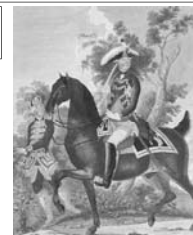
Willem V

Willem V (1748-1806) wordt over het algemeen gezien als een zwakke stadhouder zonder gezag. Willem V was in tegenstelling tot een aantal dappere en heldhaftige voorgangers van hem inderdaad geen groot militair en strateeg, maar zijn kwaliteiten lagen heel ergens anders. Waar veel stadhouders zich bezig hadden gehouden met oorlogen en veldslagen, besteedde Willem V liever zijn tijd aan het lezen van boeken en aan de wetenschap. Hij had een enorme boekenverzameling, waar later de Koninklijke Bibliotheek uit voort zou komen. Daarnaast had hij ook een grote kunstcollectie en een grote collectie van allerlei zaken die met wetenschap hadden te maken, zoals opgezette dieren, bijzondere stenen en fossielen. Ook had Willem een eigen dierentuin, waar allerlei vreemde dieren rondliepen. Willem trouwde met Wilhemina van Pruisen, zijn achternicht. In die tijd was dat