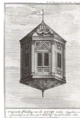
De luchtballon

harden, dus verzonnen de Engelsen een manier om dat tegen te gaan, de WC. Het waren twee schalen, die boven elkaar bevestigd waren. Als je klaar was gooide je er een emmer water achteraan. De kleine of grote boodschap verdween door het gat en er bleef in de bovenste schaal een klein laagje water staan als afsluiter voor de stank.