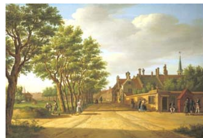
Het Leprooohuis