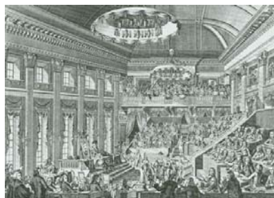
De eerste Nationale Vergadering in 1796

weerstand bieden aan de overweldigers en maakte het leven van de Romeinen in de omringende legerplaatsen bepaald niet gemakkelijk... De Bataafse republiek leek totaal niet op de Republiek der 7 Verenigde Nederlanden in de 17e eeuw. Om te beginnen was Nederland naar Frans model georganiseerd als een eenheidsstaat, die centraal vanuit Den Haag werd bestuurd. Geen losse provincies met allemaal hun eigen belangen meer, maar één Nederland. Er kwam ook een scheiding van kerk en staat. Vanaf toen mochten ook joden en katholieken een baan zoals burgemeester of minister hebben. Twee jaar lang had de Bataafse Republiek zelfs een soort vorm van democratie, namelijk de Nationale Vergadering. Deze Nationale Vergadering was de voorloper van de Tweede Kamer en hield zijn bijeenkomsten altijd