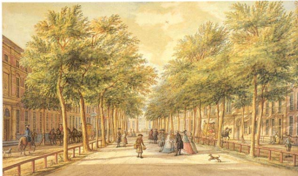
Chique heren en dames laten zich op het Lange Voorhout van hun beste kant zien

Den Haag Rond 1770 was het Lange Voorhout bij uitstek de plek waar de rijke elite zich liet zien. Van ongeveer 3 uur 's-middags tot 7 uur 's-avonds was het daar vooral 'zien en gezien worden.' Rijke mannen en vrouwen flaneerde dan over het Lange Voorhout in hun mooiste kleding. In de volksmond werd dit ook wel de 'pantoffelparade' genoemd. Het flaneren deden deze mensen vooral omdat ze moesten laten zien aan andere mensen hoe rijk en belangrijk ze wel niet waren, maar vaak werd ook van deze gelegenheid gebruik gemaakt om een geschikte huwelijkskandidaat uit te zoeken. Het is