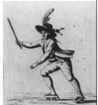
De 'nieuwwetische schaatsenrijder' uit Zwitserland.

zijn rolschaatsen uittestte was op een feestje. De Belg kon alleen zijn evenwicht niet bewaren, waardoor hij dwars door een dure spiegel knalde!